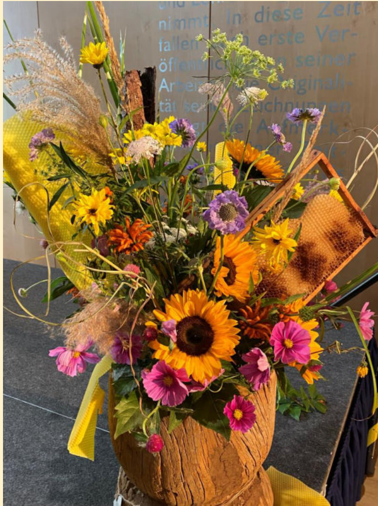
Blumenstrauß beim Imkerkongress in Dresden, 12./13.10.2023