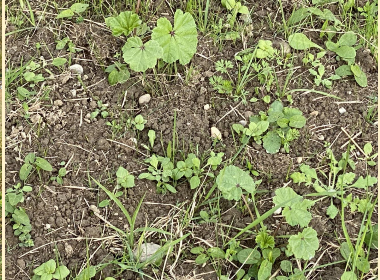
Pimpernelle, Malve, Boretsch, Sonnenblumen ...