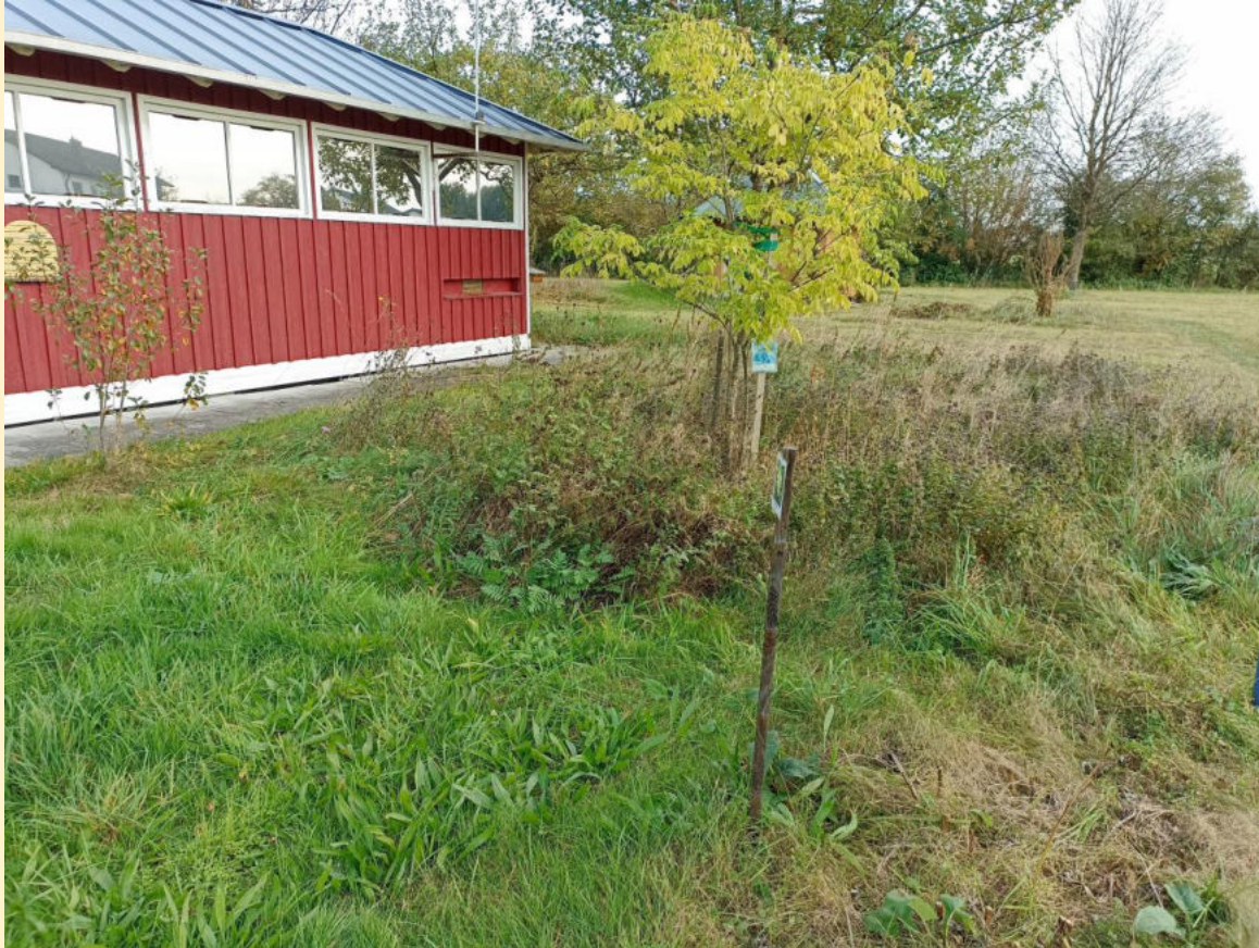
Die abgeblühten Pflanzen machen Platz .....