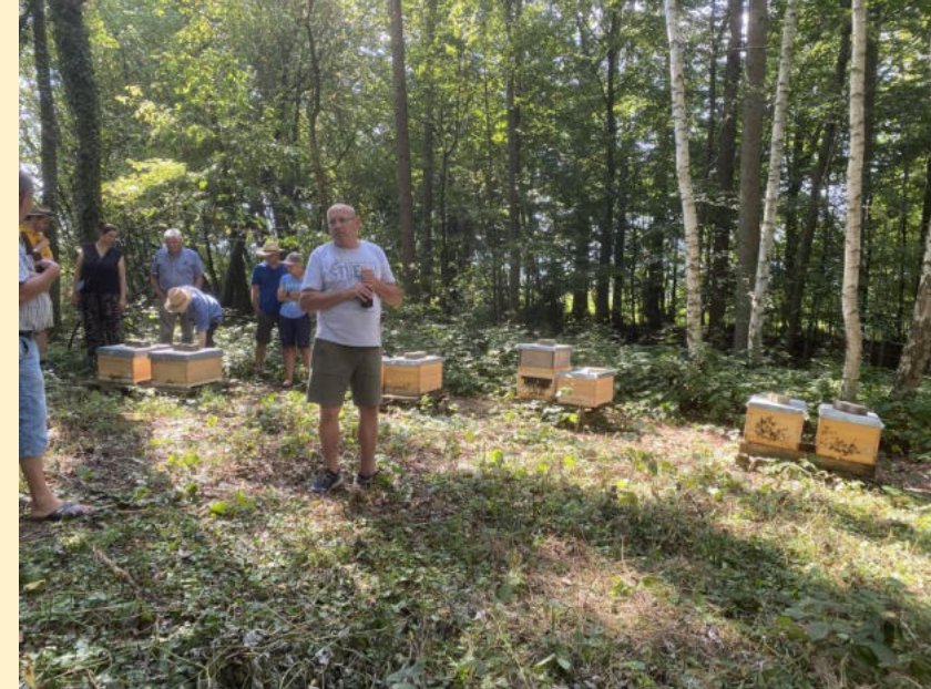
Neuer Bio-Bienenstand im Wald