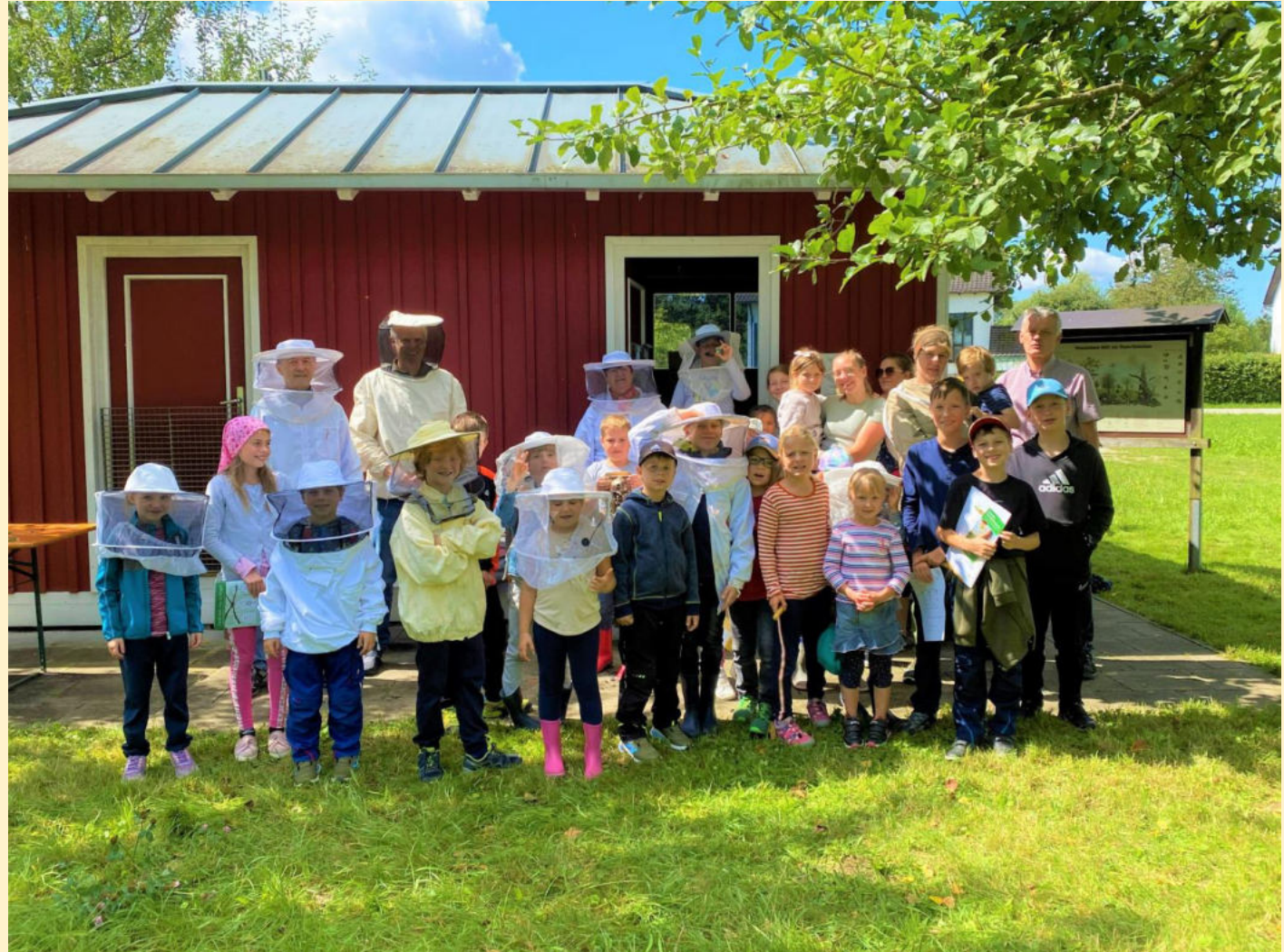
Mit Hut sich wie ein richtiger Imker fühlen