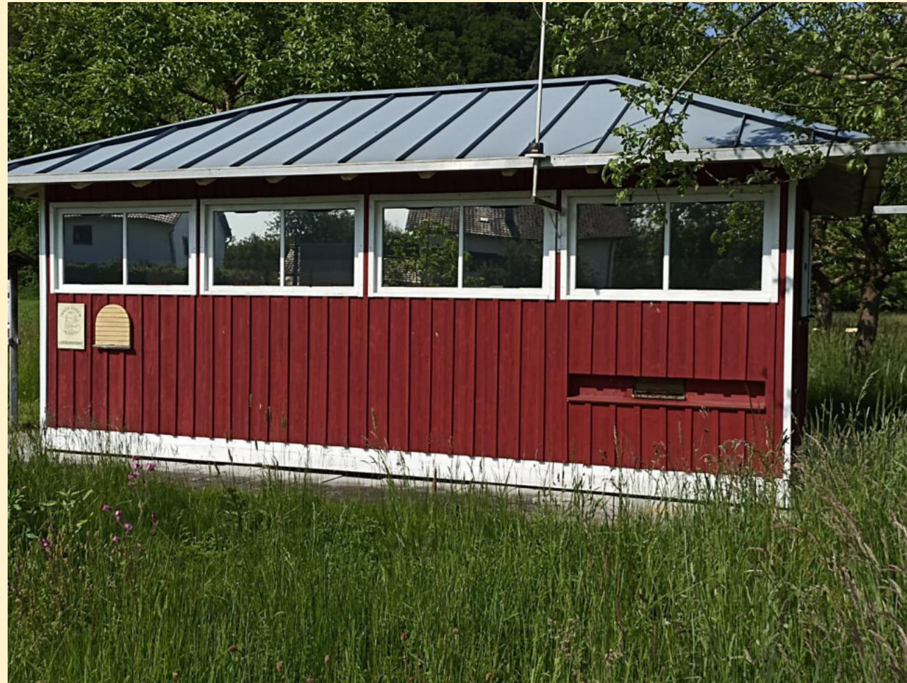
Sonnenschutzfolien lassen die Fenster spiegeln