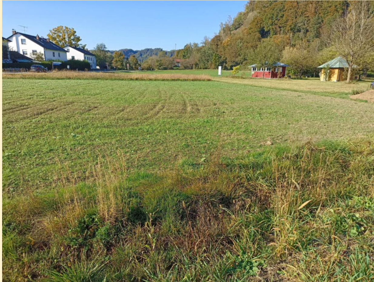
Und es grünt schon wieder