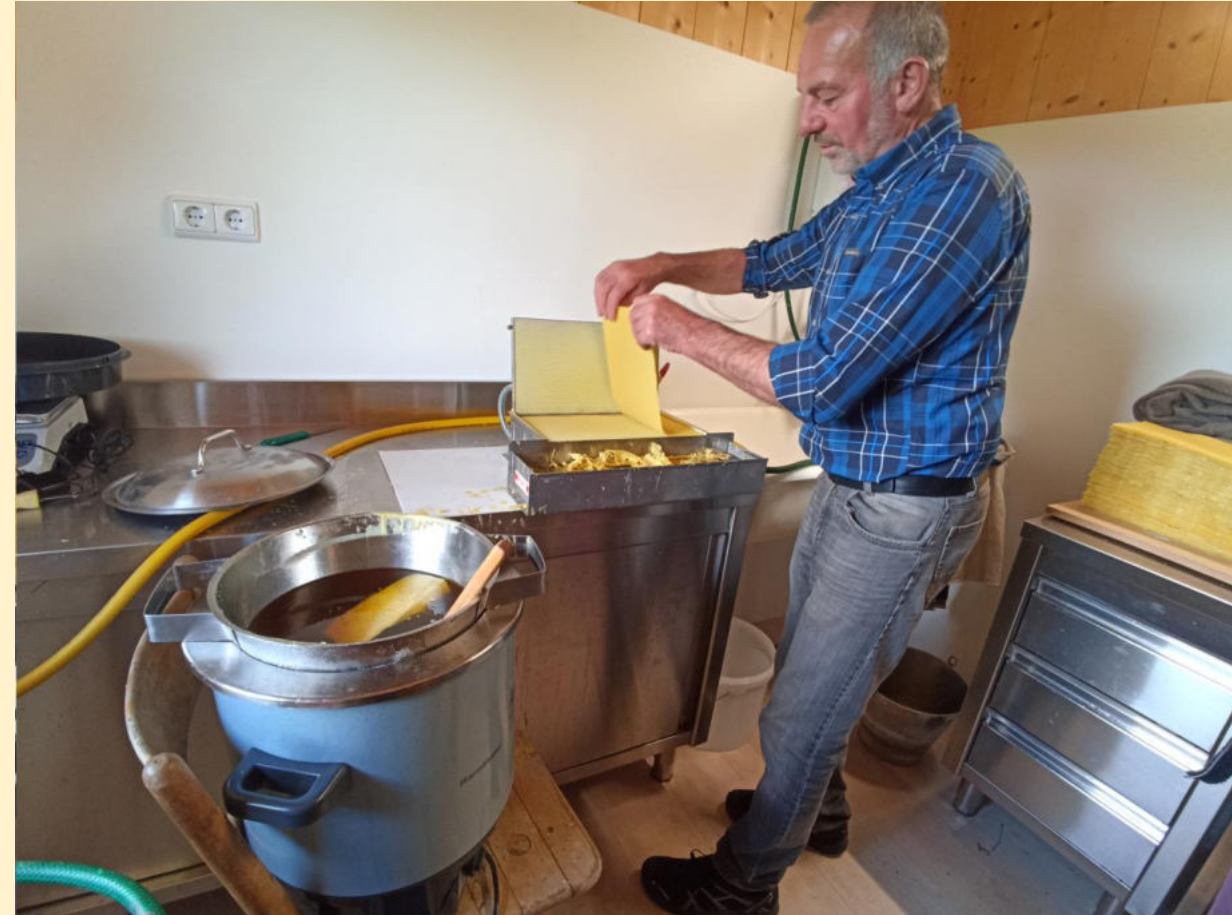
Mit der Wachspressen gelingen erstaunlich dünne Mittelwände