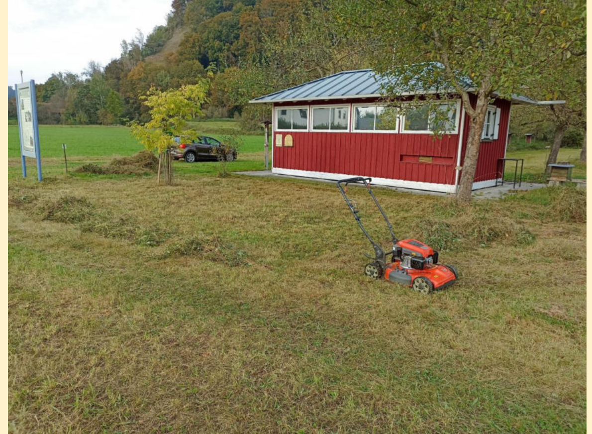
..... für neue Blüten im nächsten Jahr